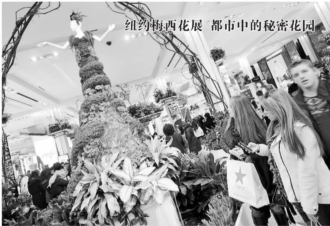
纽约梅西花展 都市中的秘密花园

同样，欧盟本身的经济实力已经足够强大，如果再加上俄罗斯的自然资源和硬实力，欧洲大陆成为世界大局中的一极是并不过分乐观的前景。