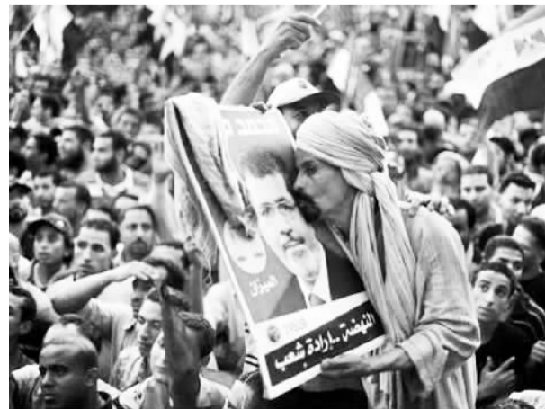
穆尔西支持者举行抗议示威

埃及各派力量也许最终会铸剑为犁，携手并肩。然而目前，他们还没有做好放下争执的准备。