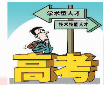
朱慧卿作

“按照目前的测算，到2020年，依然可能有1亿多进城农村人口无法拥有城市户籍，这个问题如何解决？”23日，北京大学汇丰商学院院长海闻向国家发改委副主