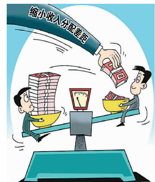
朱慧卿作

对于公务员晒工资，许多网友对此举表示了鼓励，认为“多晒晒总是好的，阳光是最好的防腐剂，百姓是最好的监督员”，这样才是在“当一个有良心、有道德、受人尊重的公务员”。“公务员需要调整自己的心态，与其怨天尤人，不如干好本职工作，对得起报酬和岗位。同