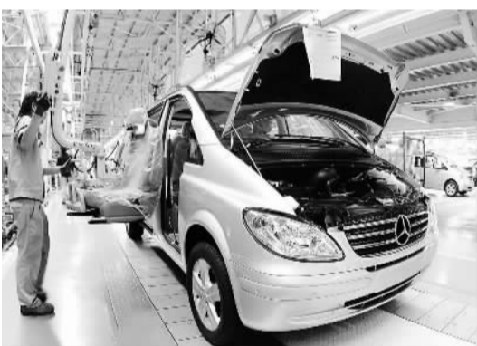
闽江口一带形成耀眼的汽车产业集群,图为落户福州闽侯县的奔驰商务车生产线。

闽江口经济圈依托的中心城市福州,张力在扩大。旧城在改造提升,“只做减法,不做加法”;新城在加快拓展,重点建设了金山新区、鼓山新区、上街大学新区等,现正快速推进马尾新城建设,马尾从单一的经济技术开发区向宜居宜业、开放现代的新市区转变。