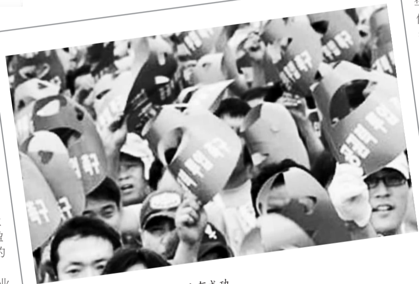
上汽与双龙的磨合最终没有成功。