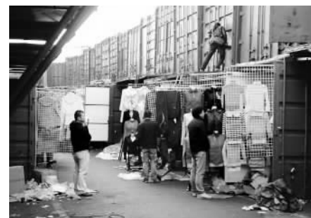
西班牙华人商贸区一角

如此看来，旅西华人要想在西班牙切实改变自己的形象，为自己正名，除了对来自西班牙社会的伤害进行抗议和回击以外，还要积极改变和转换自身的发展模式，让西班牙当地社会能够从华人的发展中获得更大的收益。而要做到这一点，从目前来看，可谓是任重而道远。