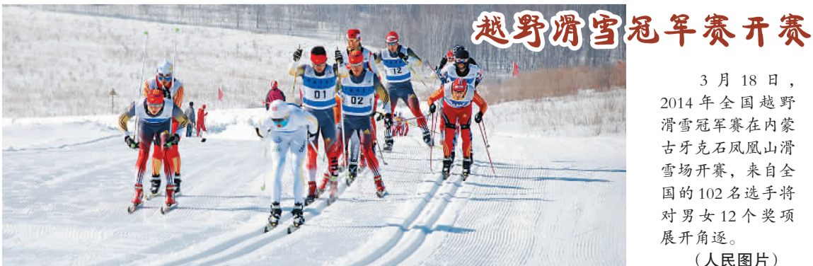
越野滑雪冠军赛开赛

3月18日,2014年全国越野滑雪冠军赛在内蒙古牙克石凤凰山滑雪场开赛,来自全国的102名选手将展开角逐。