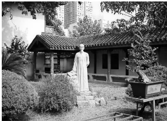
秦淮水亭一角

据考，吴敬梓当年所居秦淮水亭邻近东关头附近，为南朝诗人江总宅地。江总，南北朝时期著名的文学家，做过梁朝尚书仆射，入陈为尚书令，其园宅名“江令宅”，是座名园。至清康熙年间，江宁织造署置于此，曹玺、曹寅均在此为过官，据说曹雪芹也在此写过《红楼梦》，此地即大观园的原型。由于岁月变迁，秦淮水亭已难寻旧迹。上世纪90年代拟依原址复建，