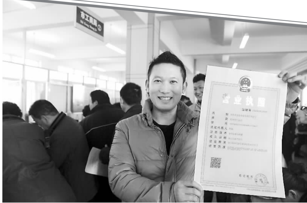
3月3日,在安徽阜阳工商注册登记窗口,一名业务员在展示领到的新版营业执照。

新修改的《公司法》和《中外合资经营企业法实施条例》、《中外合作经营企业法实施条例》、《外资企业法实施条例》和《公司登记管理条例》、《企业法人登记管理条例》等行政法规,主要体现在公司、企业注册资本实缴登记制度改为认缴登记制度,取消注册资本最低限额,改年检验批制度为登记备案、公示制度,取消对“三资企业”因未按期缴纳出资,商务主管部门有权撤销批准证书和工商管理部门吊销营业执照的规定等方面。这些法律法规运用法治方式推进政府职能由管理向服务转变,进一步放宽市场主体准入条件,降低公司企业设立门槛,激发社会投资活力,减轻了投资者负担。