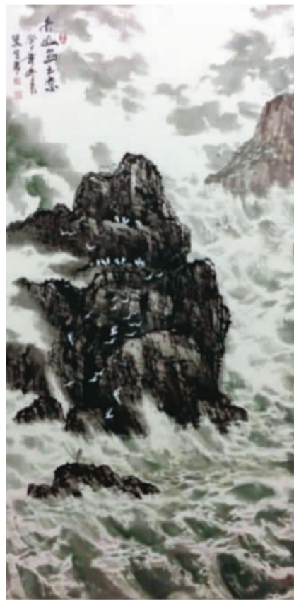
舟山岛之恋 冀有泉作

由民革中央、中华人民共和国文化部、中央文史研究馆、国家海洋局主办，民革中央画院承办的“祖国岛屿风情书画展”日前在中国美术馆举行。展览展出200余幅佳作。艺术家们用各自的艺术语言描绘、讲述祖国的座座岛屿，向世人昭示，当代中国书画家与全国人民一起，密切关注着祖国岛屿的历史和现状。著名军旅画家、国家一级美术师冀有泉应邀参展。