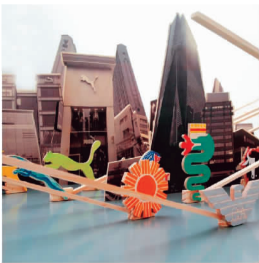
野生动物 (视频装置)

以动画和漫画为主题的动漫美学双年展日前在清华大学美术学院美术馆揭幕。中、韩、英三国10位艺术家共展出50多件艺术品。这是该展览在继高雄市立美术馆及韩国大邱美术馆开展后的又一次亮相。