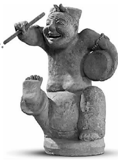
东汉击鼓说唱陶俑（中国国家博物馆藏品）

由中国民间文艺家协会主办的“中国口头文学遗产数字化工程（一期）成果展示会”日前在京举行。该数据库现已完成录入中国口头文学遗产资料4905本，包含116.5万篇（条）神话、传说、歌谣、谚语、歇后语、谜语、民间说唱等，总字数达8.878亿字，几乎囊括了新中国成立以来中国口头文学收集的原始资料，堪称一部手掌上的“民间四库全书”。