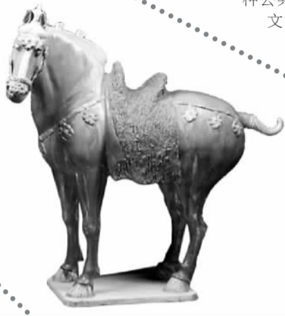
唐三彩三花马（陕西历史博物馆藏品）

“让藏在禁宫中的文物活起来。”宋新潮说，可以通过普查建立服务平台将文物在网上展示。通过数字化方式进行传播，有助于加深人们对文物的具体了解和认识，把文物变成一种公共的文化