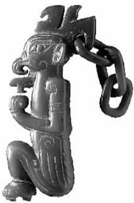
▲活环羽人玉佩饰：迄今发现最早的玉“羽人”，制作巧妙，为目前所见最早的活链玉器，内涵丰富，文化独特，在中国玉器史上具有重要地位。