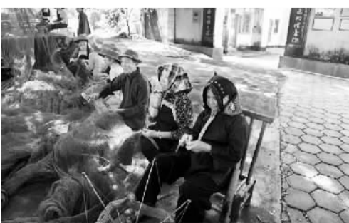
大澳渔村村民们织渔网