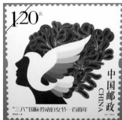
《“三八”国际劳动妇女节一百周年》纪念邮票