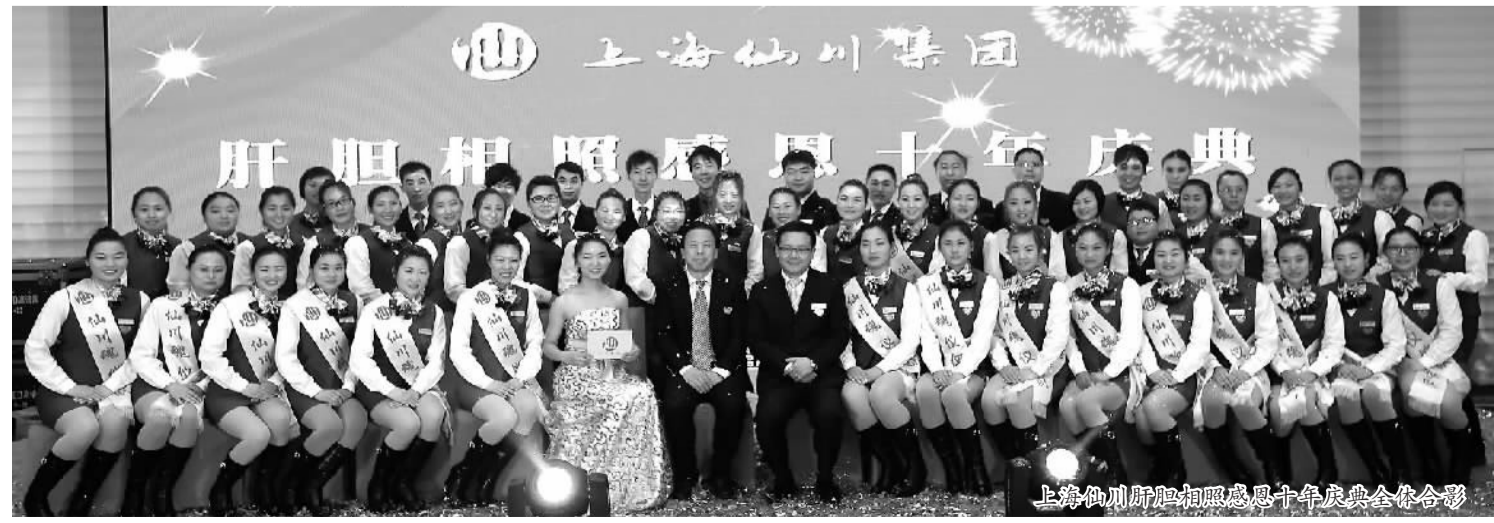
上海仙川肝胆相照感恩十年庆典全体合影

古人云：“将执兵之权，兵斩将之势，譬如猛虎，加之羽翼翱翔四海，随所遇而施。”仙川人经过十年不懈的努力，目前已成为企业的好管家，外来打工者的娘家。十年，岁月悄然转动不息的齿轮，刹那间连成历史。十年，流走的是光阴，留下的是友谊；流动的是人才，留下的精神。我们期待下一个十年的光芒四射，期待下一个十年弥漫着收获后的快感！