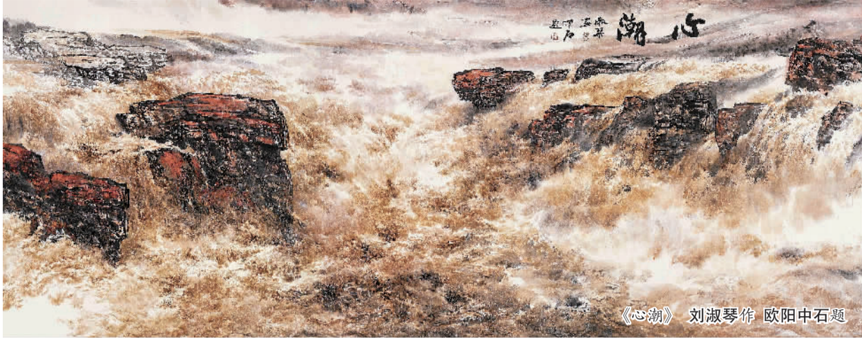
《心潮》 刘淑琴作 欧阳中石题