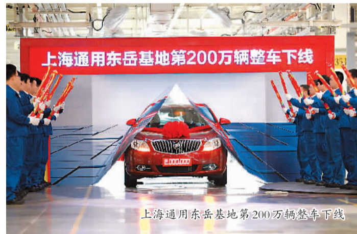
上海通用东岳基地第200万辆整车下线

曾经,烟台开发区也面临着要素驱动的粗放、同质化竞争。经过多年的发展实践,我们逐渐认识到,建设创新型开发区,实现“智造”现代化才是强区之本。因此,开发区按照“引进人才,创办企业,带动产业”的思路,在政策保障、产业培育和环境建设等方面统筹谋划,积极打造吸引尖端人才和高科技项目的“强磁场”。