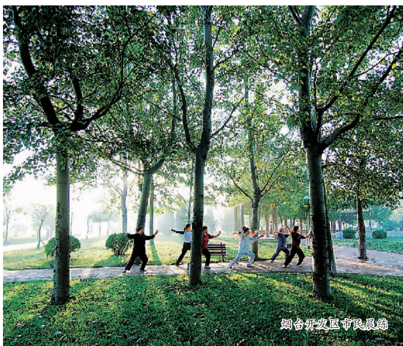
烟台开发区市民晨练

30年风雨历程,30年春华秋实,烟台开发区的发展成就,是兴办国家级经济技术开发区的成功力证。潮平两岸阔,风正一帆悬,站在更高起点上的烟台开发区,正向着明天破浪远航!