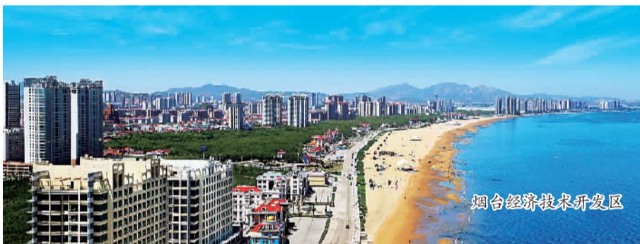
烟台经济技术开发区

布局绽放,点亮了东部主城区商业服务圈。中心大道长江路沿线主要布局行政办公、金融商务、文化娱乐等设施,打造高品质中心区空间形象轴。以天地广场为核心,东侧的天马广场