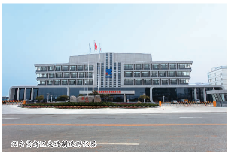
烟台高新区先进制造孵化器