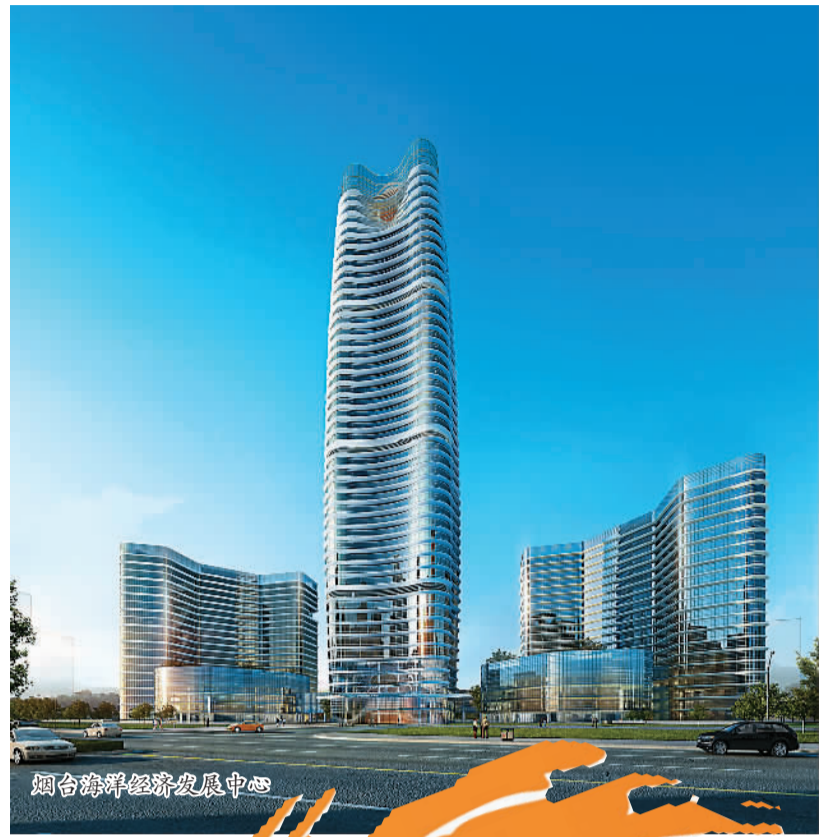
烟台海洋经济发展中心

不仅如此，站在更高、更广的视野中，加快发展东部新区，有利于探索海洋经济发展新模式、新路径、新机制，为我国海洋经济发展积累成功经验；有利于加快山东半岛蓝色经济区建设，集聚海洋经济发展要素，发挥辐射带动作用，促进全省海洋经济新区协调互动发展；有利于促进区域合作发展，加强与日本、韩国国际贸易合作，实现区域发展合作共赢。