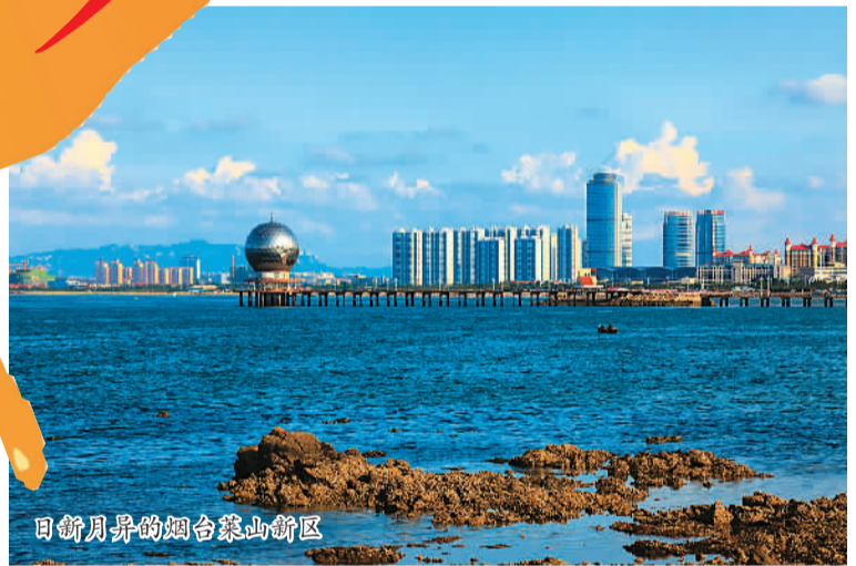
日新月异的烟台莱山新区

——临港保税物流区。以烟台保税港区、烟台港芝罘湾港区及周边区域为主体，建设具有重要影响力的区域性国际物流中心、航运服务中心。高标