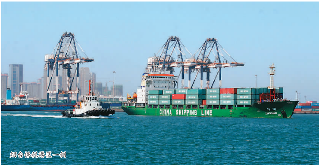
烟台保税港区一隅

建设烟台东部海洋经济新区，是烟台市委、市政府抢抓机遇，全面加快高端海洋经济发展作出的一项重大战略部署，是烟台构建“一极领先、多极崛起”发展新格局的重中之重和“一号工程”。它包括烟台高新区、牟平区的养马岛旅游度假区、经济开发区、沁水韩国工业园、台湾工业园、牟平城区、龙泉镇、莱山区的解甲庄、黄海路街道，芝罘区的东山、幸福、芝罘岛街道，以及烟台保税港区A区，面积600平方公里，人口75万人，海岸线长150公里。