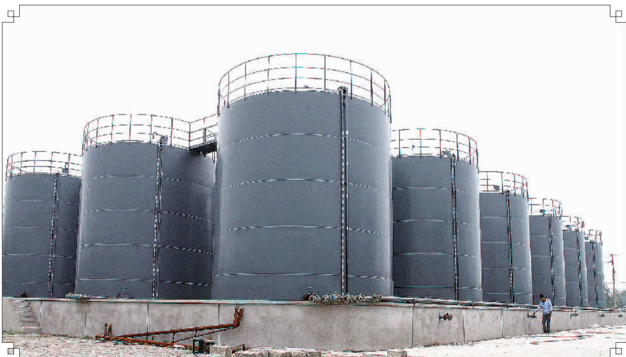
液体化工仓储基地