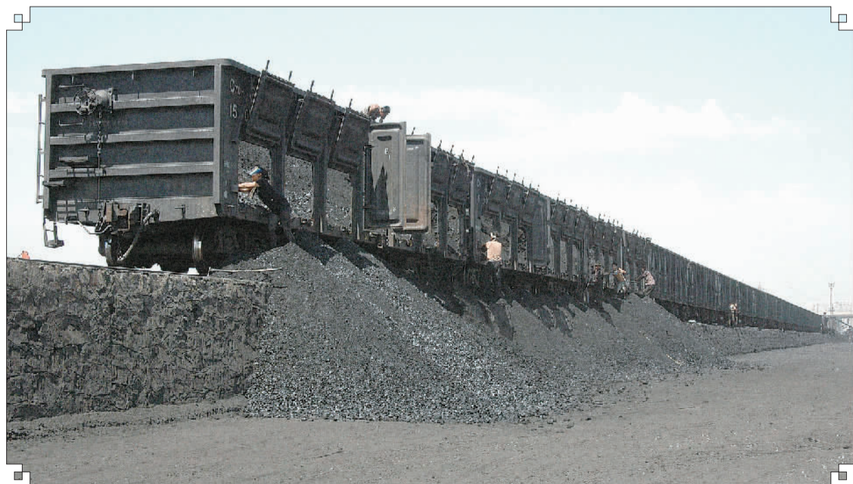
集团煤炭运输专线