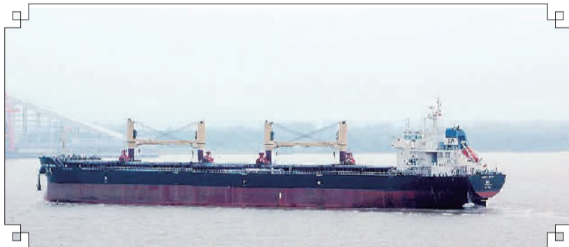
集团自有运输船舶