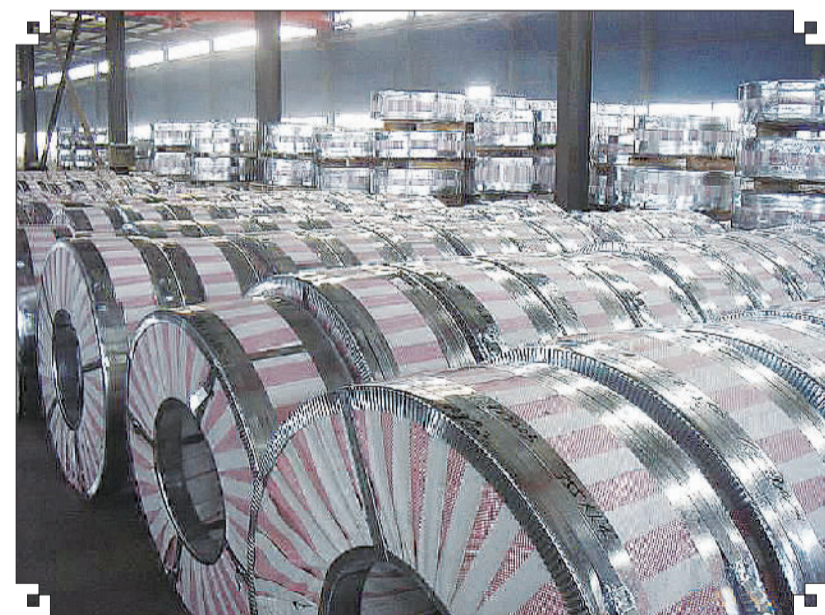
集团经营的黑色金属产品