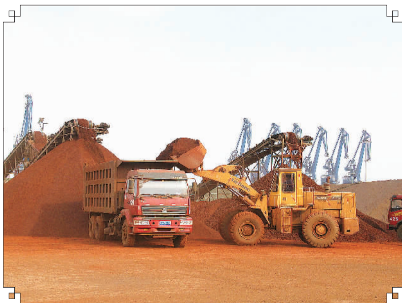
集团矿石加工基地