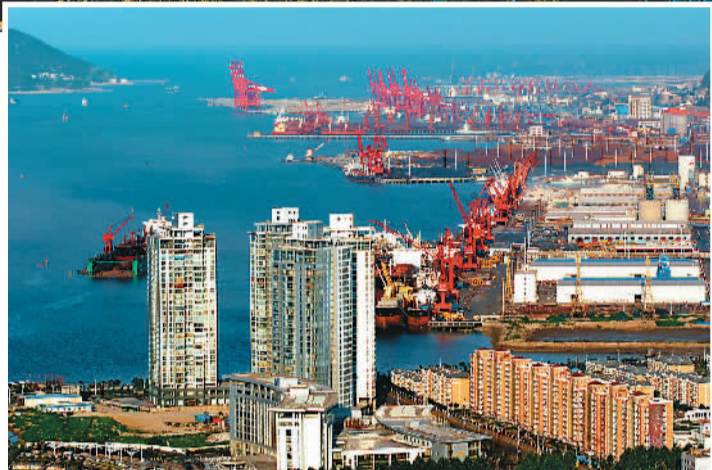
压题图片:山海相拥魅力港城。

未来的连云港,将由连云港新城作为“一心”,徐圩新区、赣榆新城、新海新区作为“三级”,并以国家东中西区域合作示范区先导区基础设施建设为基础,形成“五纵五横”交通运输框架、“一区七园”发展格局,建设与东方桥头堡角色相匹配的城市综合基础与政府公共服务能力。