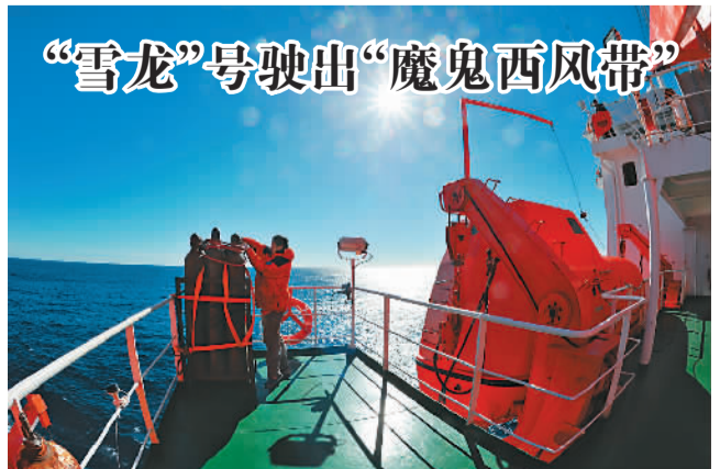
3月9日,正在回国途中的中国第30次南极科学考察队乘坐“雪龙”号,顺利驶出波涛汹涌的“魔鬼西风带”,进入印度洋。

刘庆峰说,人们的生活跟互联网越来越紧密,产生了越来越多的数据,这些数据还没有很好地用起来。他介绍说,美国在“9·11”后就开始重视大数据反恐,2013年美国反恐局长曾提到通过大数据成功挫败了50多起恐怖事件。刘庆峰建议,各部门把相关大数据统一汇总,通过数据挖掘助力公共安全。同时,刘庆峰还建议制定和完善相关的法律法规来维护个人隐私,维护和保障好国家安全和个人隐私之间的平衡。