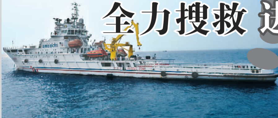
准备出发的“南海救101”(3月9日拍摄)。

本报北京3月9日电(记者刘峻)3月9日下午,境外中国公民和机构安全保护工作部际联席会议召开第二次会议,外交部、中宣部、公安部、交通运输部、海警局、民航局、国信办、国务院应急办等部门、军方和北京市负责人出席。会议要求,各单位按照职责分工,加强沟通协调,继续尽全力开展搜救工作,及时发布权威信息。