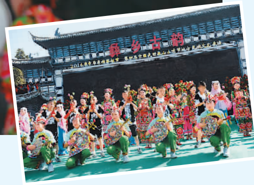
表演舞蹈《东山彝韵 紫金打歌》。 小图：彝族演员在表演歌舞《南诏传人》。