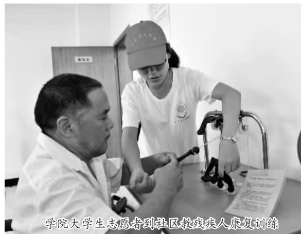
学院大学生志愿者到社区教残疾人康复训练

在学院的课程与教学中，始终以培养这种复合能力为重点，基本形成以残疾儿童诊断评估、个别化教育与残疾儿童康复训练及学科教育教学能力培养为本位的课程体系和教学体系。据院长方仪介绍，这种体系最大的特点就是“主辅结合、精一通X”。“主辅结合”即课程分主修和辅修两大类。主修课程保证学生在某一专业方向上知识技能的深度和广度，突出“精一”。辅修课程主要解决掌握另一门专业基