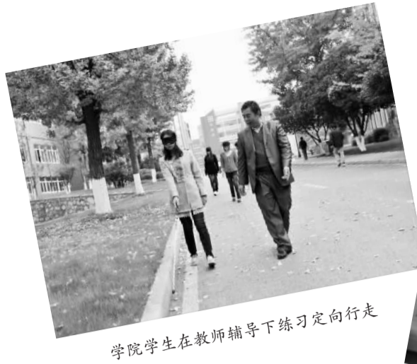
学院学生在教师辅导下练习定向行走

办学32年来，学院立足江苏，面向全国，始终把服务特殊教育和残疾人事业作为办学宗旨，坚持“博爱塑魂、质量为本、特色立业”的办学理念，不断提升办学水平，成为全国唯一一所独立设置的、专门以培养特殊教育师资为主的普通高等学校，为全国特殊教育师资的培养做出了重要贡献。