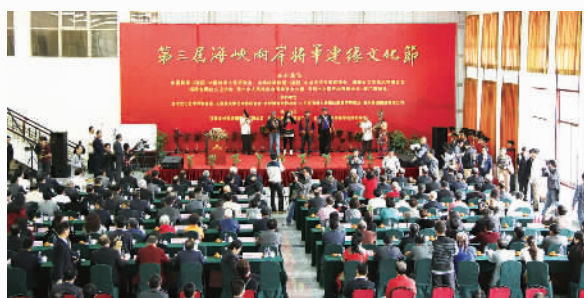
第三届海峡两岸将军连缘文化节开幕式现场盛况