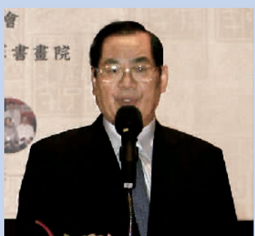
中国国民党副主席曾永权

我们感谢连董事长今天的到来，福建漳州长泰的连氏画院我虽然没有去过，不过我听过我们很多到福建去的朋友讲。大家去了以后很感动，连董事长他虽然是经商已经非常有成就，但是他非常热心于怎样推动我们的文化，所以他就成立了这个画院。画院成立以后还请了国民党的荣誉主席连战题字，后来也请了我们的荣誉主席吴伯雄先生题字。他对两岸的文化交流非常的热心，这个也是今天我们两岸已经走到一个交流又和解的时代，我相信透过文化透过艺术书画展现这样一个合作交流这个效果会更大。