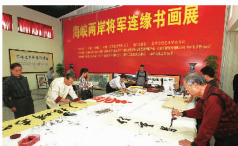
第二届海峡两岸将军连缘文化节将军现场挥毫