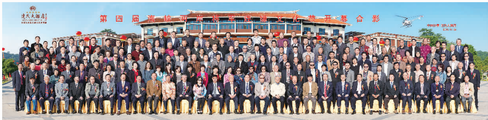
第四届海峡两岸将军连缘文化节主办单位：中国将军书画院、中华连氏宗亲联谊会、中华将军教授书画院(台湾)