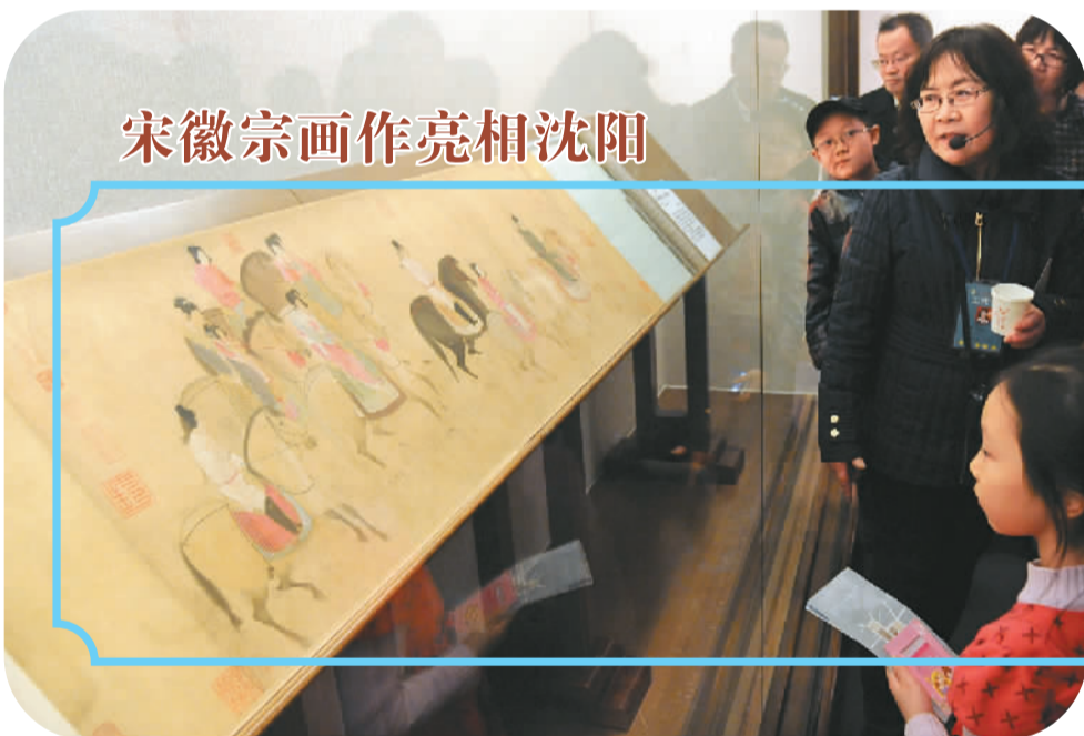
宋徽宗画作亮相沈阳

此外,参保人员无论是从城乡居民养老保险转入城镇职工养老保险,还是从城镇职工养老保险转入城乡居民养老保险,都将个人账户全部储存额随同转移,累计计算权益。 胡晓义说,2013年全国城镇职工养老保险总收入接近2.25万亿元,支出约1.84万亿元,当期结余4000多亿元。