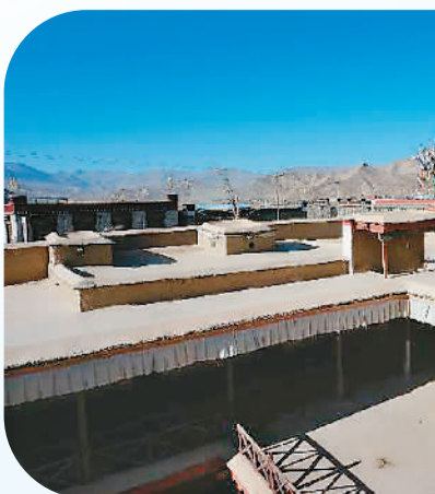
▲妈妈正在为女儿整理节日的衣裳。普赤家的阳光房。

的缩影。自治区政府工作报告提出,要促进旅游与文化、生态融合发展,充分彰显优秀传统文化和原生态魅力,力争农牧民参与旅游服务的人数达到8万人以上。 “我们还打算用微信、微博等方式推广我们的旅游项目。”白地乡副乡长平措顿珠说。