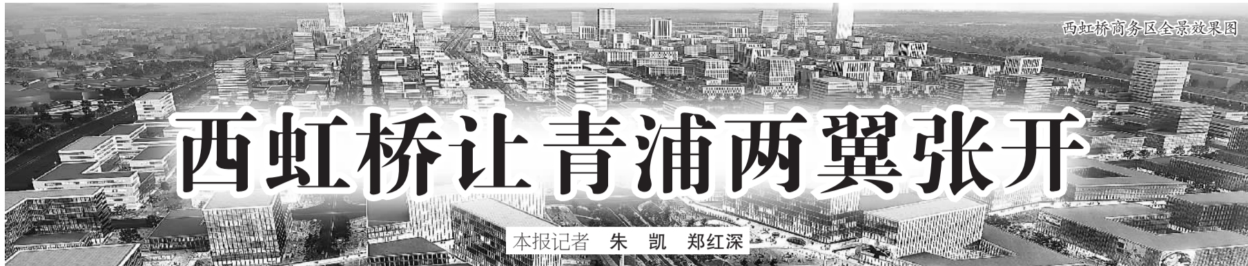
本报记者 朱凯 郑红深