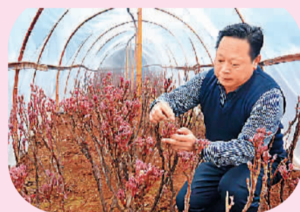
2月20日，一位园林技术人员在温棚内观察牡丹枝叶生长和花芽发育状况。马年春节过后，洛阳市中国花园对750亩、1080个品种的60余万株牡丹开始进行全面的春耕除草、修剪萌蘖、病虫害防治等养护工作，以确保牡丹在4月份第32届中国洛阳牡丹文化节期间按时开花，达到最佳观赏效果。