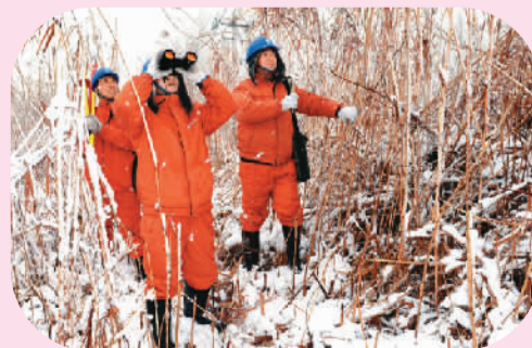
2月18日，洪泽湖区迎来新年第一场大雪，江苏省洪泽县供电公司加大对湖区电力线路设备管理力度，紧急组织人员步行巡视，确保湖区232公里供电线路设备安全。图为电力职工冒雪巡查湖区供电线路。