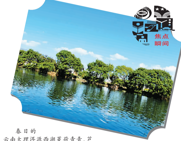
春日的云南大理洱源西湖菱荷青青、芦苇摇曳，村庄、岛屿散落水中，白族风俗浓郁，构成村中有湖、湖中有村的独特田园风景。近年来，当地按照“生态恢复、点面结合，活水疏导、退塘(耕)还湖”治理方针，采取措施综合整治，使“高原明珠”重放光彩。