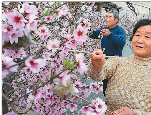
2月19日,河南省开封市南郊一油桃种植基地数十座大棚内油桃花盛开,花香扑鼻。图为果农们在为油桃花授粉。