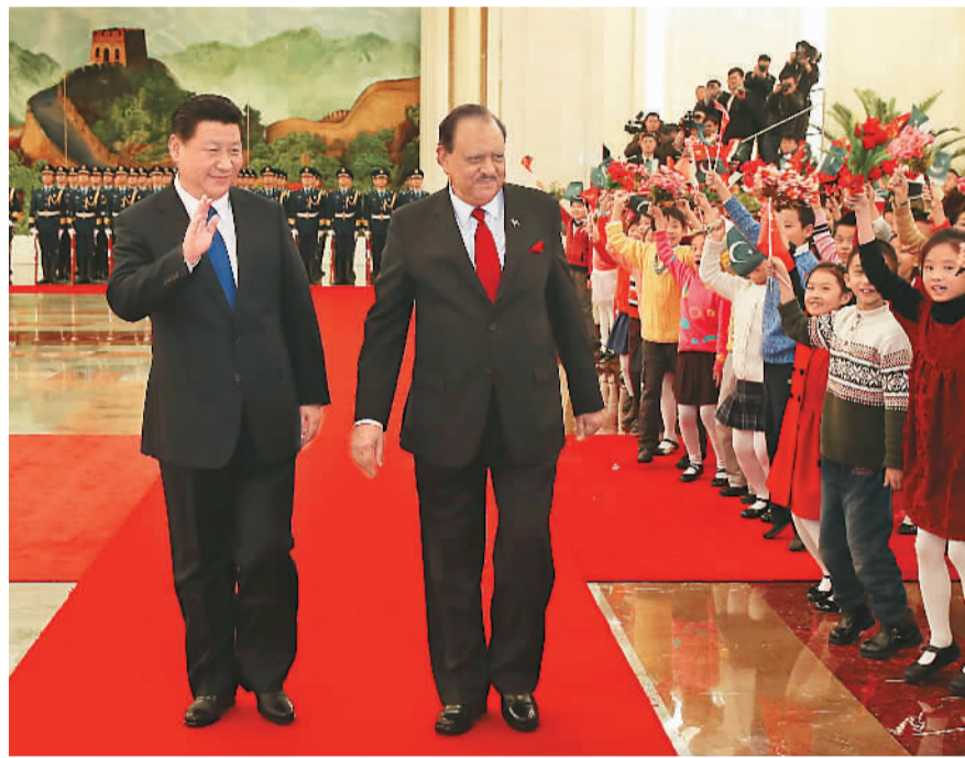
图为会谈前,习近平在人民大会堂北大厅为侯赛因举行欢迎仪式。