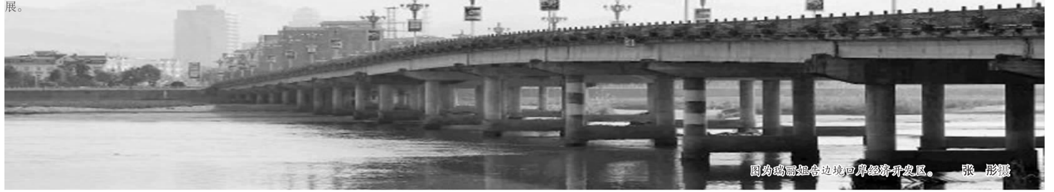
图为瑞丽姐告边境口岸经济开发区。

“金融入滇”工程是沿边金融综合改革试验区建设中的重点。云南省将面向东盟、南亚国家和台港澳地区，加大金融招商力度，力争在引进外资和全国性金融机构来云南设立国际性或区域性管理总部、业务运营总部、后援服务中心和培训基地，发展与总公司同等全牌照业务的分公司上实现突破。充分发挥驻滇全国性金融机构作用，内引外联，充分利用全国性金融市场，并积极引导鼓励民间资本进入金融服务领域。