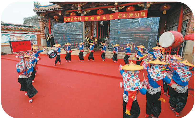
2月13日，福建省惠安县青山村举行“两岸同名缘 元宵无线情”活动，与同根、同源、同名的台湾台北市青山里乡亲空中连线祭祖，共迎元宵佳节。图为惠安女腰鼓队在表演。