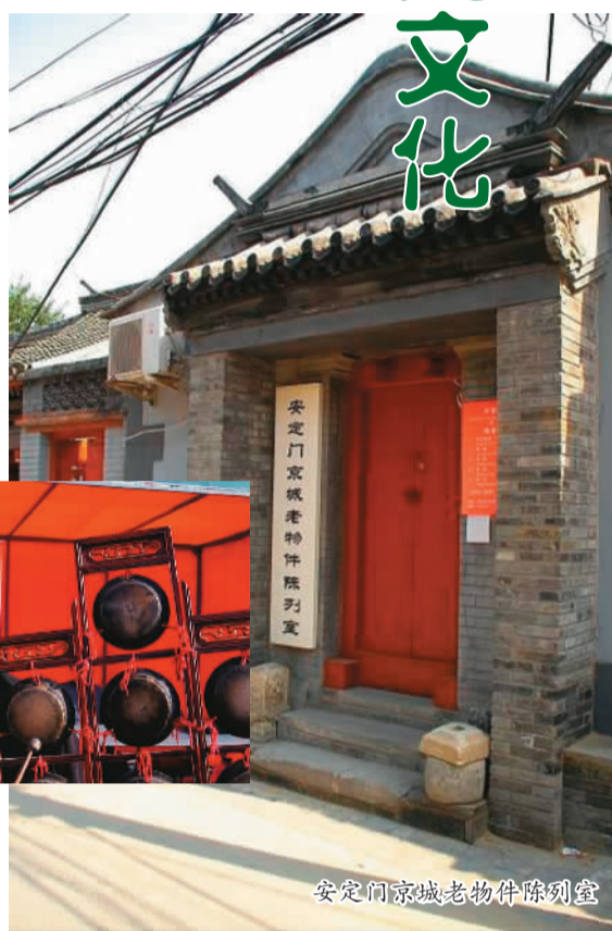
安定门京城老物件陈列室