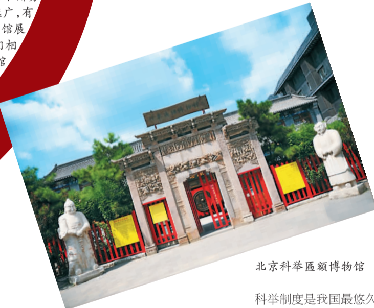
北京科举匾额博物馆

科举制度是我国最悠久独特的历史文化，在以往的各种影视作品中“进京赶考”也早已被大家所熟知。那么真正的科举考场是什么样呢？古时科考舞弊都有哪些手法？状元们的试卷究竟长什么样？如果你对这些问题感兴趣，那位于北京朝阳区高碑店的北京科举匾额博物馆是满足你好奇心的一个好去处。