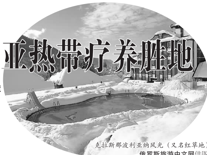
克拉斯诺达尔州风光(又名红草地)

上场馆都是相互比邻的。索契奥林匹克公园也被公认为奥运史上最美丽的公园之一,每座场馆都可称得上是一部建筑杰作。