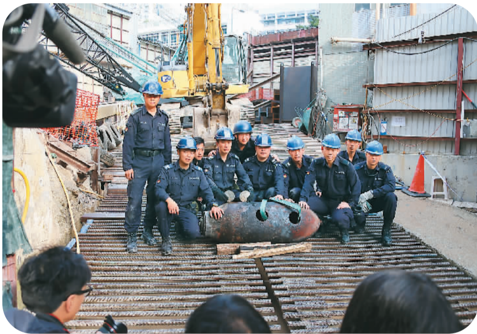
2月7日早晨,香港警方表示,经过连夜紧张工作,警方炸弹处理组已成功切断6日在香港市区发现的一枚疑为二战时期遗留的炸弹,并取出全部炸药,弹壳已被运走。图为炸弹处理组与炸弹弹壳合影。