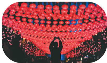
2月6日,沈阳“盛京城庙会灯会”开幕。图为游客用手机拍照留念。