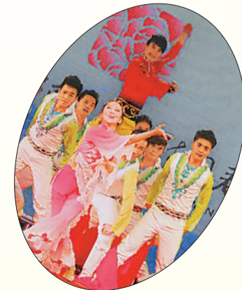
暨南大学大学生艺术团表演舞蹈《万紫千红拜大年》。