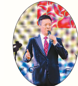
歌唱家阎维文在演唱。