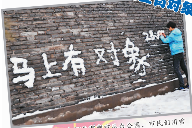
2月5日，在河北邯郸市丛台公园，市民们用雪在古城墙上拼成各种字样，来表达自己的愿望。