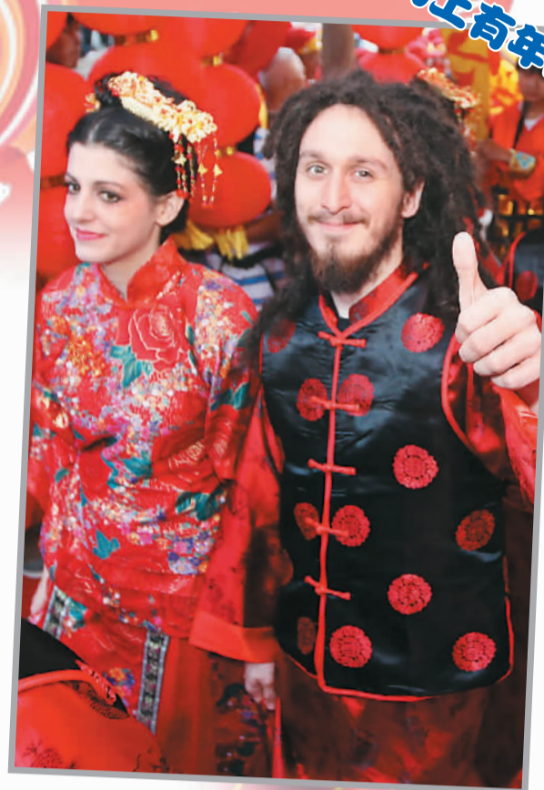
春节期间，在江苏南京夫子庙，一些外国朋友身着中国“唐装”游古城、赏花灯、享民俗，体验中国人的过年习俗。