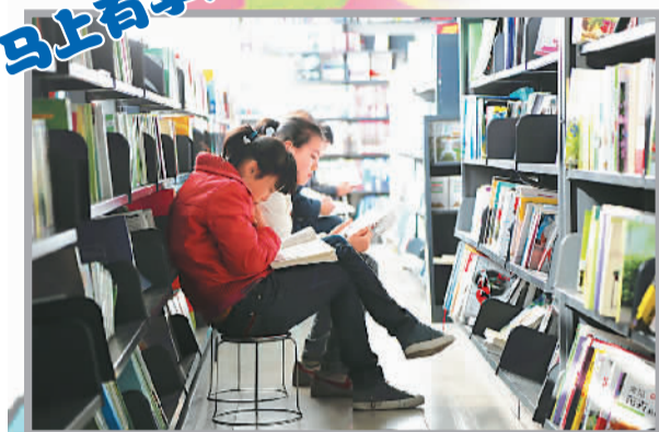
2月3日，宁夏银川书城，很多孩子在聚精会神地看书。一位正在买书的小朋友告诉记者：“拿到压岁钱的第一件事，就是逛书店。”在这里，春节透着淡淡的书香。