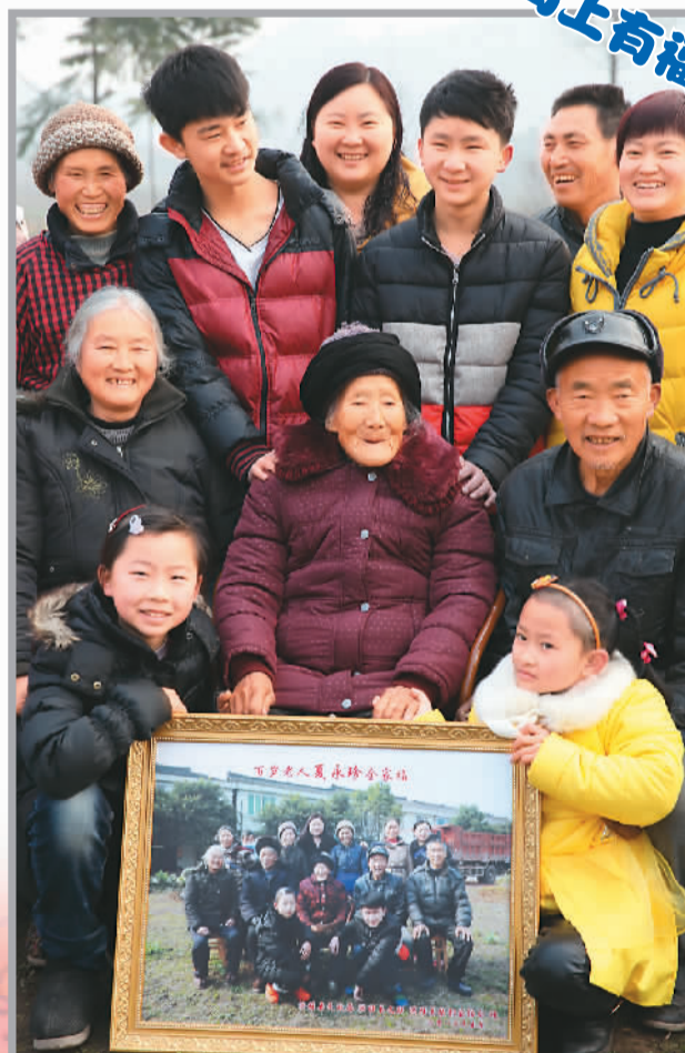
春节期间，四川省洪雅县启动以“我的百岁人生，我的马年幸福生活”为主题的拍摄全家福活动。目前，洪雅县有21位百岁老人，都在春节期间享受免费拍摄一组22寸并装裱好的全家福。