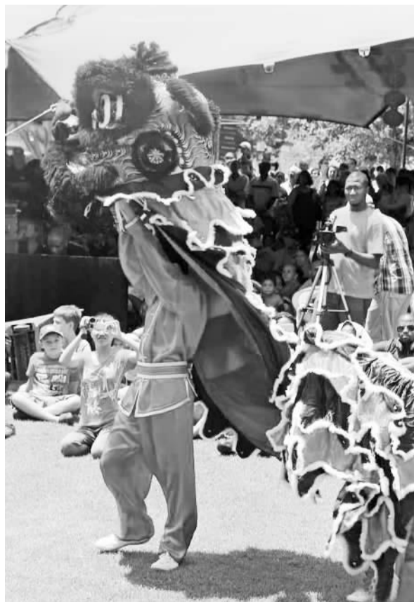
图为南非“欢乐春节”文化庙会上的舞龙舞狮表演。