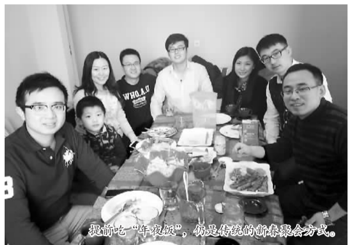
提前吃“年夜饭”，仍是传统的新春聚会方式。

在农历甲午马年即将到来之际，全国各地留学生创业园和海归组织举办的新春交流活动纷至沓来。新春交流会，狂欢主题派对，海归联谊会，海归相亲会，海归舞会，这类带着新新人类标签的活动越来越多。