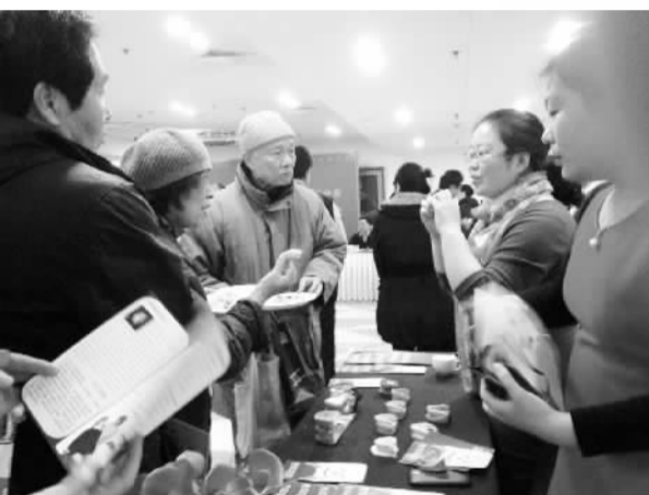
春节联欢聚会常常是提供多种服务的平台。图为欧美同学会留加分会联谊会现场。

“欢快的音乐响起来，红红的条幅挂起来”，欧美同学会总会会所内很是热闹，2014年中加合作展望论坛暨欧美同学会留加分会新春联谊会在230余名到场海归学子的掌声中正式拉开帷幕。除了传统的新春联欢文艺节目，加拿大分会更是在服务留加学子奉献社会方面力求新颖，从内容、形式上进行了大胆创新与改变。