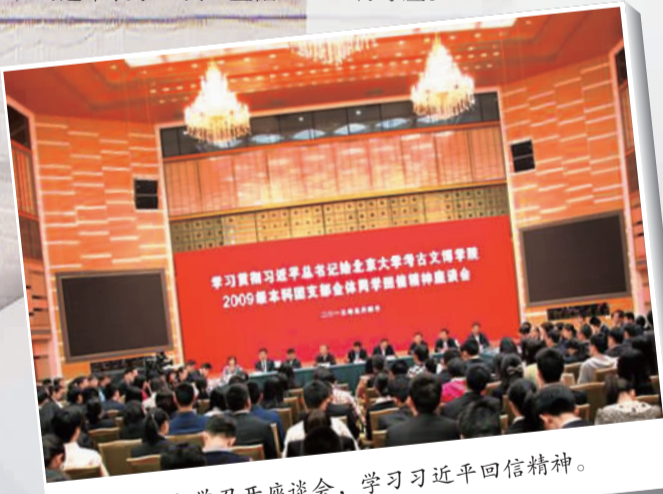
北京大学召开座谈会，学习习近平回信精神。