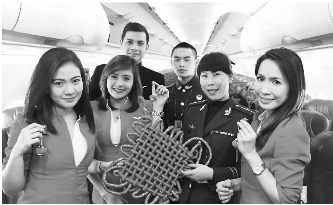
1月27日，福建泉州边检站在晋江国际机场开展“喜迎中国年 文明中国礼”活动，边检官兵为出入境旅客准备了具有传统特色的中国结、香包、灯笼等礼品，为其讲解中国春节习俗。图为外籍旅客、外籍机组工作人员感受文明中国年的氛围。