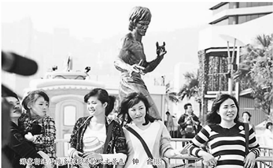
游客留恋于维多利亚港的人文景色 钟合摄

旅游业是香港经济支柱，内地旅客更是旅游业“火车头”，但近年社会上因两地文化差异，引起不少争拗，有人要求为访港内地旅客人数设限。特区政府给出的答案是，暂不扩大“个人游”城市及一签多行安排，但也不会为访港旅客人数设限。苏锦梁直言，明白旅客可能会对市民带来不便，“可能坐地铁时，这班未必上到，要等多一班”，但香港是自由港，也是细小而外向型的经济体，因此不应为旅客人数设限。他希望市民明白有关不便不是旅游发展的“副作用”，香港需在两者之间取平衡。