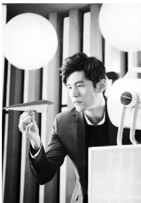
图为《最强大脑》场景

《最强大脑》之所以能一炮打响，并且受到越来越多的观众的欢迎及好评，与节目的题材定位新颖有很大关系。这是国内首档科学真人秀节目。从相关报道中可见，《最强大脑》被贴上了“科学温度”、“高智商”、“励