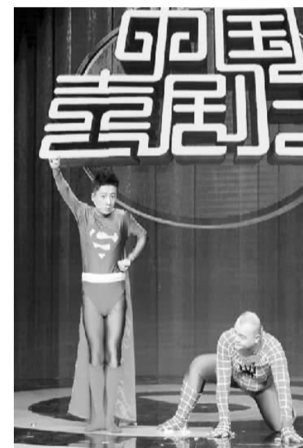
图为《中国喜剧星》场景

据了解，经过重重考验进入导师阵营的学员将会得到一线喜剧编创团队为其量身定制的原创作品支持，而挖掘更多的喜剧人才也成为节目的主要任务之一。“会演戏的比会唱歌的人少，会演喜剧的人一定更少。”既是影视演员也是台湾著名剧团“表演工作坊”元老的李立群说，“让人笑比让人哭难得多。喜剧的难在于演员对节奏、情绪的把控和组合，首先你要有一个好的故事，然后要用滑稽的方式表演出来，还要上升到讽刺的高度。至于讽刺什么，为什么讽刺，是最考验演员功底的地方。”