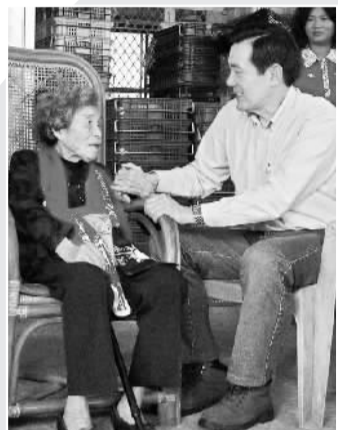
马英九探视小桃阿嬷。

据台湾《中国时报》报道，马英九1月18日到台湾屏东农业生物科技园区参访后，到麟洛果菜市场参访。