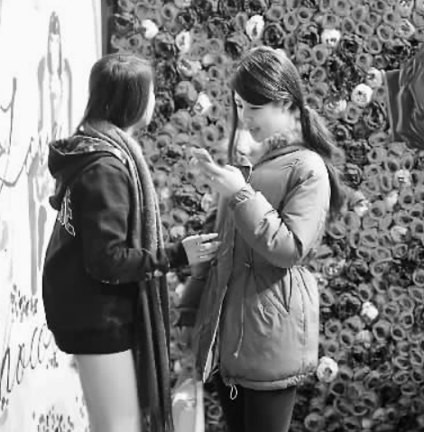
香港海港城第五届“情·寻朱古力”艺术展近日开展，顾客们走进了巧克力浪漫的甜蜜国度。

香港海港城第五届“情·寻朱古力”艺术展近日开展，顾客们走进了巧克力浪漫的甜蜜国度。