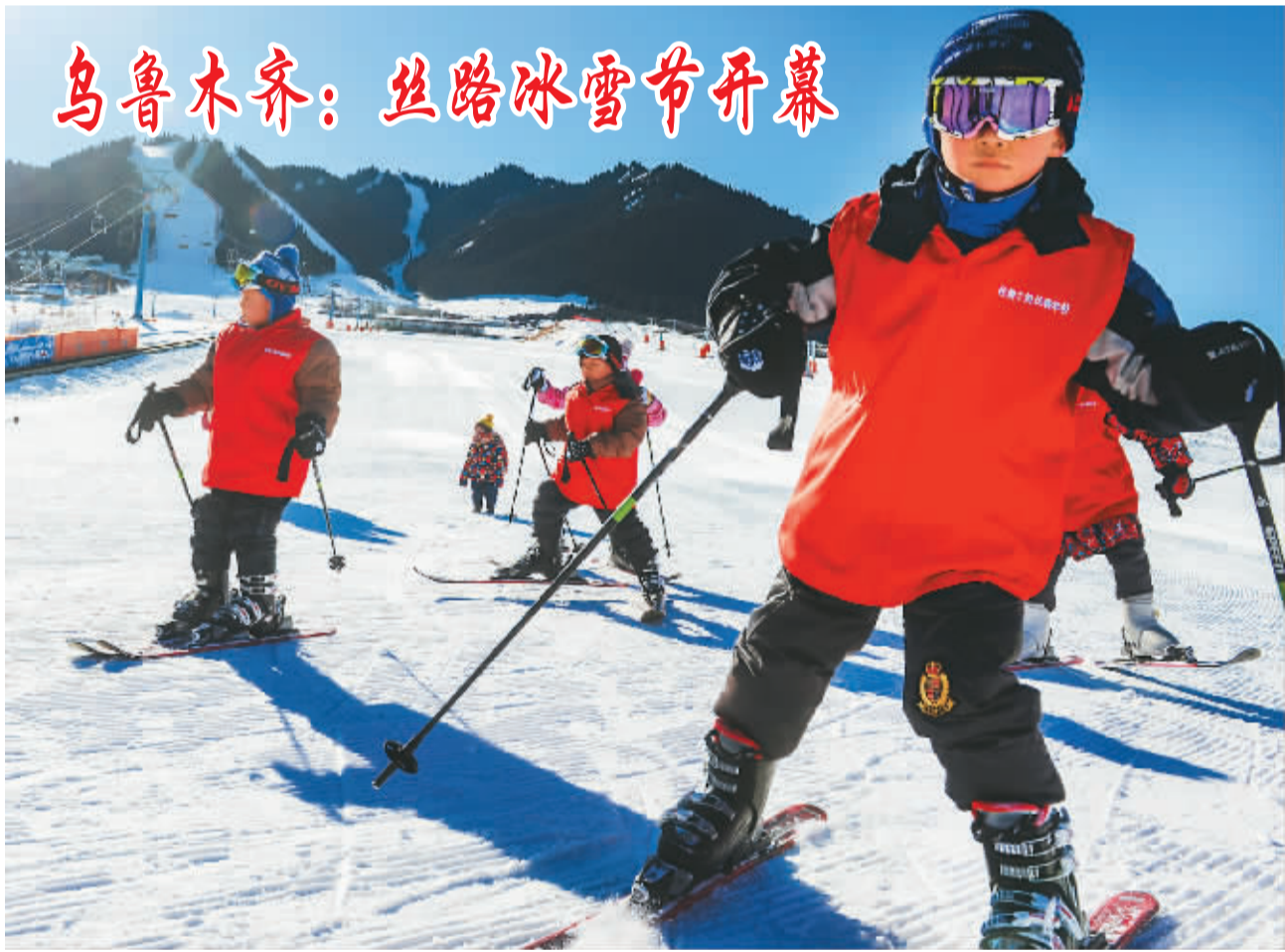
一月十日，第十一届乌鲁木齐丝绸之路冰雪风情节开幕。冰雪节历时两个多月，期间组委会将在每周日至周四（节假日除外）组织市民到滑雪场免费体验滑雪。图为儿童在开幕式现场表演滑雪。