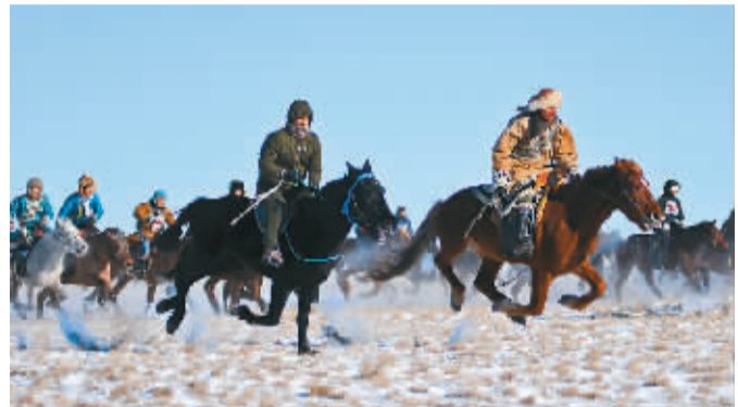
1月10日，“银色乌珠穆沁——冰雪那达慕”活动在内蒙古锡林郭勒盟东乌珠穆沁旗开幕。本届那达慕包括民族服饰展示、摔跤、赛马、赛驼、大力士、射箭等比赛项目。