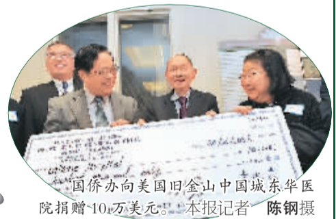
“国侨办向美国旧金山中国城东华医院捐赠10万美元”。

2013年，各级侨办积极配合做好《外国人入境出境管理条例》立法工作，推动设立探亲签证和团聚类居留证件，为外籍华人来华提供便利。