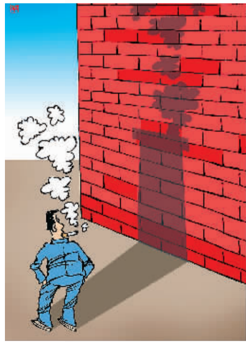
影子 杨树山作

都知道吸烟有害健康，但是，在很多人眼里，抽烟不仅是个人习惯，也是一种有效的社交手段。小小一根烟，被赋予了更多含义。