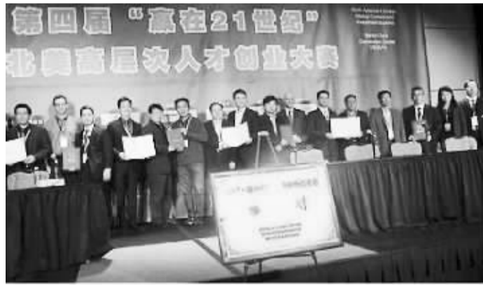
第四届北美高层次人才创业大赛现场

委和嘉宾提问。这种形式我是第二次见到，快节奏、强竞争，是风险投资领域常用的展示——评估模式。参赛团队的主要任务就是吸引投资者，说服他们相信自己的产品或理念能够给社会带来收益、提高人们的生活质量，从而为项目开发获取资金支持。