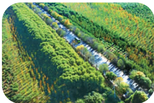
2012年和2013年，北京市已完成平原造林61万亩，今年将完成百万亩平原造林的主体建设任务。 李继辉摄（航拍资料图）

今年北京市将实施35万亩平原造林任务。来自北京市园林绿化局的消息，去年北京平原地区完成造林36.4万亩，植树1705万株。今年计划完成35万亩，加上2012年完成的25万亩，力争在2014年基本完成北京市平原地区百万亩造林主体任务目标。