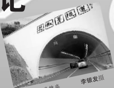
隧道雄姿