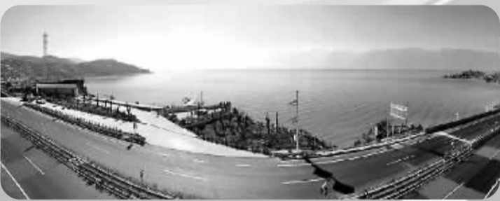
大理公路双廊段

心、市场信息中心、物流集散中心和服务中心，其在全国花卉市场的主导地位和影响力日益凸显。随着近日拥有600个交易席位、6个交易大钟的新拍卖交易大厅建成投入使用，昆明花卉拍卖中心的交易规模将由现在的每天200万枝跃升至600万枝，可实现多笔撮合竞价、实时远程交易、远程供货交易以及拍前预售等多种交易模式，标志着我国花卉交易与国际全面接轨。