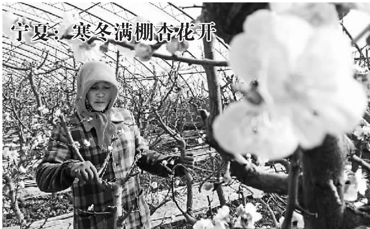
近日，已进入数九寒天的宁夏永宁县望洪镇设施农业大棚里种植的杏树进入花期，满棚花朵盛开。据了解，当地种植的反季节杏子将于4月左右上市。图为农民在大棚里查看杏花授粉情况。