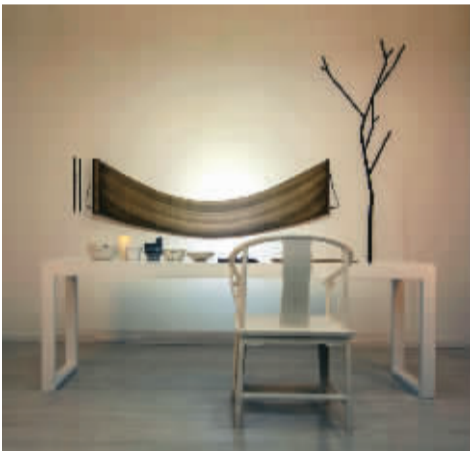
丝绸 &amp; 剩余价值 姜吉安

在本次大展中，参展作品的主题，不仅是传统的花鸟虫鱼、山水草木、英雄美人，还扩大表现了当代社会生活图景、文化