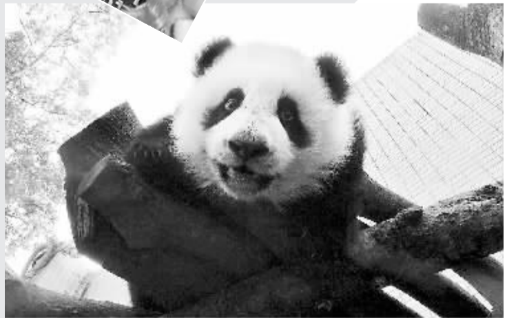
▲2013年12月31日,大熊猫“圆仔”在台北动物园保育员的镜头前玩耍,仿佛为人们送去新年的祝福。