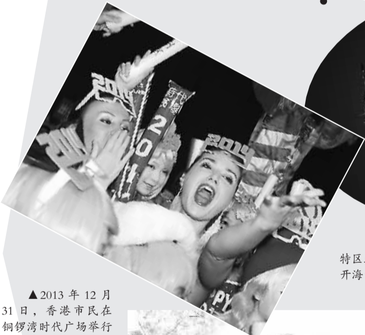
▲2013年12月31日,香港市民在铜锣湾时代广场举行倒计时晚会,迎接2014年的到来。