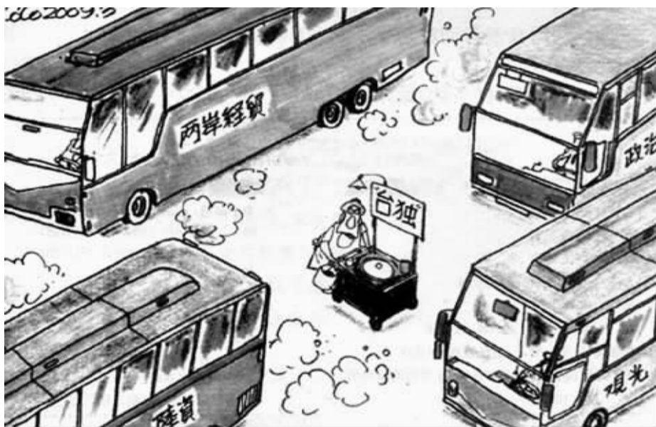
台湾漫画讽刺“台独”走投无路