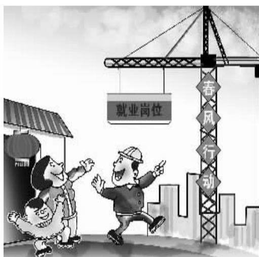
赵乃育作

由河南瑞邦环境科技有限公司、郑州大学和郑州瑞邦数码地暖科技有限公司联合研发的“空气源热泵无水地暖系统技术及产品”在北京通过国家级鉴定。数据表明,和传统的空气热泵和地板采暖相比,该项技术节能达50%以上。图为技术人员在现场演示其原理。