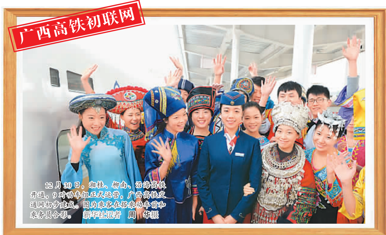
12月30日，湘桂、柳南、沿海高铁开通，9对动车组正式运营，广西高铁交通网初步建成。图为乘客在榕榕动车站和乘务员合影。

生育政策调整的方法步骤为，根据人口与计划生育法的规定，各省(区、市)人民政府在全面评估当地人口形势、计划生育工作基础及政策实施风险的情况下，制定单独两孩政策实施方案，报国务院主管部门备案，由省级人民代表大会或其常委会修订地方性法规或作出规定，依法组织实施。