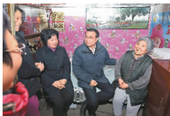
12月27日,李克强在西于庄棚户区入户看望困难群众。

他说,你们的住房困难和改善意愿,我们都记住了,政府和大家一起努力,一定尽快让你们搬进新房。李克强对随行的同志说,改善民生就是要特别关注做好棚改等保基本、兜底线、雪中送炭的事,政府要有硬措施。不仅要增加各级财政投入,还要创新方式,加大金融支持力度,鼓励民间资本参与,使更多困难群众早日圆上安居梦。