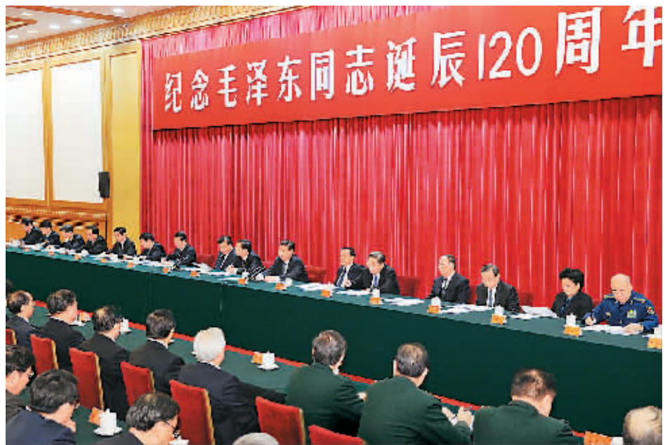
习近平、李克强、张德江、俞正声、刘云山、王岐山、张高丽等出席座谈会。