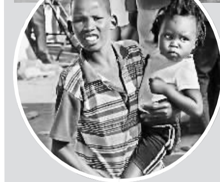
近日发生在南苏丹的武装冲突和暴力攻击，已导致数百人伤亡、成千上万人流离失所。大批难民涌进当地的联合国维和部队营地寻求庇护。