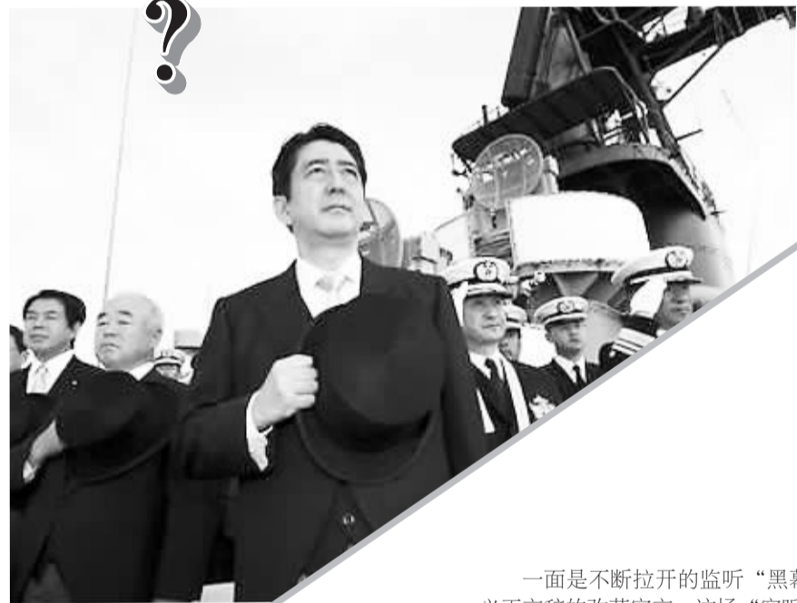
日本首相 安倍晋三 资料图片

古今多少事，皆因利而起。国安局源源不断的监控情报给美国带来的经济利益与外交优势不言而喻，改革现有的监听体制，实属重压之下的无奈之举。报告中的建议最终有多少能通过，又有多少能确保被落实？整个世界都在等待。