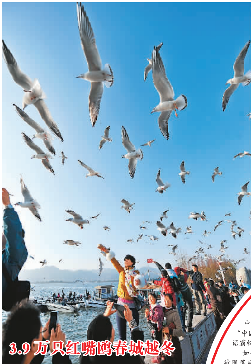
3.9万只红嘴鸥春城越冬

12月22日,人们在昆明滇池草海大坝喂食红嘴鸥。经158名工作人员在62个点同步统计,今年冬天到昆明越冬的红嘴鸥数量约39230只,创历年之最。