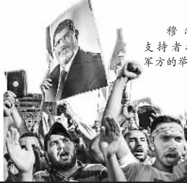
穆尔西支持者抗议军方的举动