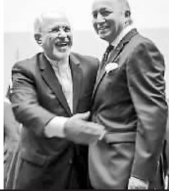
伊核协议达成后，双方代表握手。(资料图)