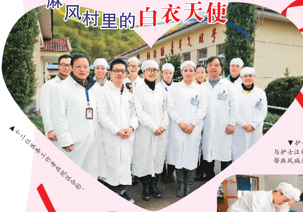
▲十位志愿者与麻风病患者合影。